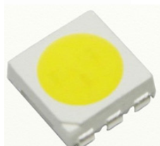
Рис. 1. Полупроводниковые источники света типа КИПД154А92 в пластмассовом корпусе 5050.

Внешний вид полупроводниковых источников света представлен на рис. 1.