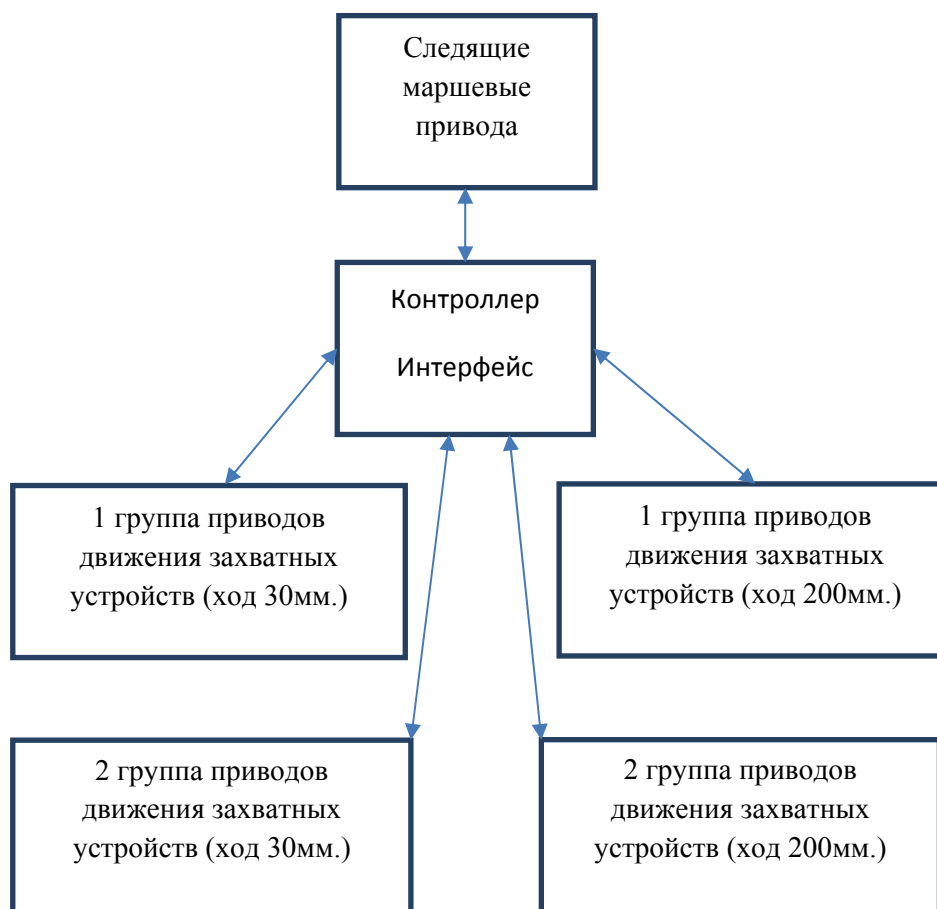
Рис. 2. Структурная схема робота вертикального перемещения.

Робот на вакуумных присосках после опускания в заданный сектор технологической операции вертикальной стены обрабатывает следующий алгоритм, необходимый для закрепления на поверхности: