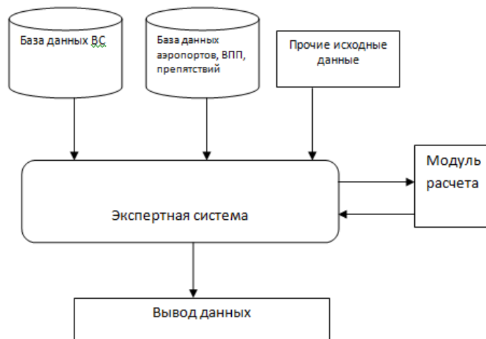
Рис. 1. Архитектура процесса расчета ВПХ.

ВПХ, либо электронными данными (оцифрованными номограммами) из руководства по летной эксплуатации.