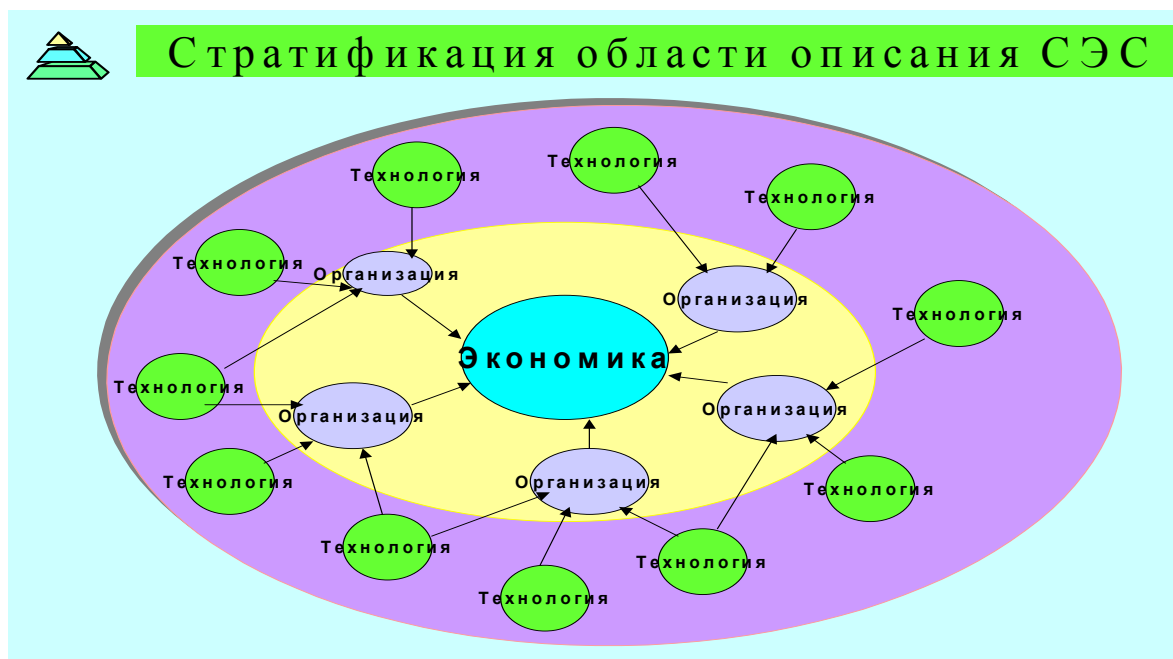
Рис. 1. Стратификация природно-общественных механизмов деятельности.

Соответствующая стратификация представлена на Рис. 1.