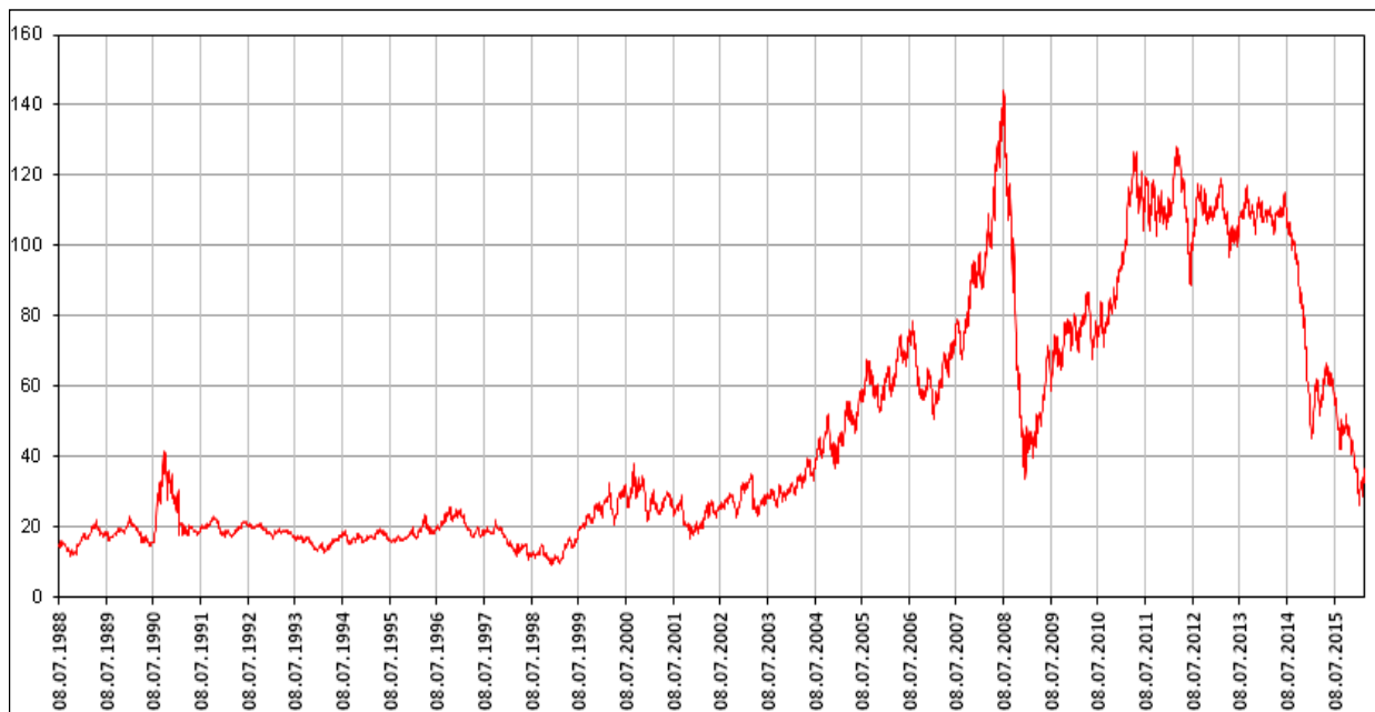
Рис. 1. Ежедневная статистика Platts Dated Brent 08.07.1988–03.03.2016.

На основании анализа всего интервала официальной статистики (Рис.1) ежедневных цен-spot на сырую нефть марки Brent с 08.07.1988 по 03.03.2016 (котировки официально устанавливаются ( http://www.platts.com/ ) информационно-аналитическим агентством Platts (Platt), Mc-Graw Hill Financial) статистика цен была разбита (в результате нахождения «точек разлома», причем различные методы дали примерно одинаковый результат) на 17 периодов стабильности [7; 8].