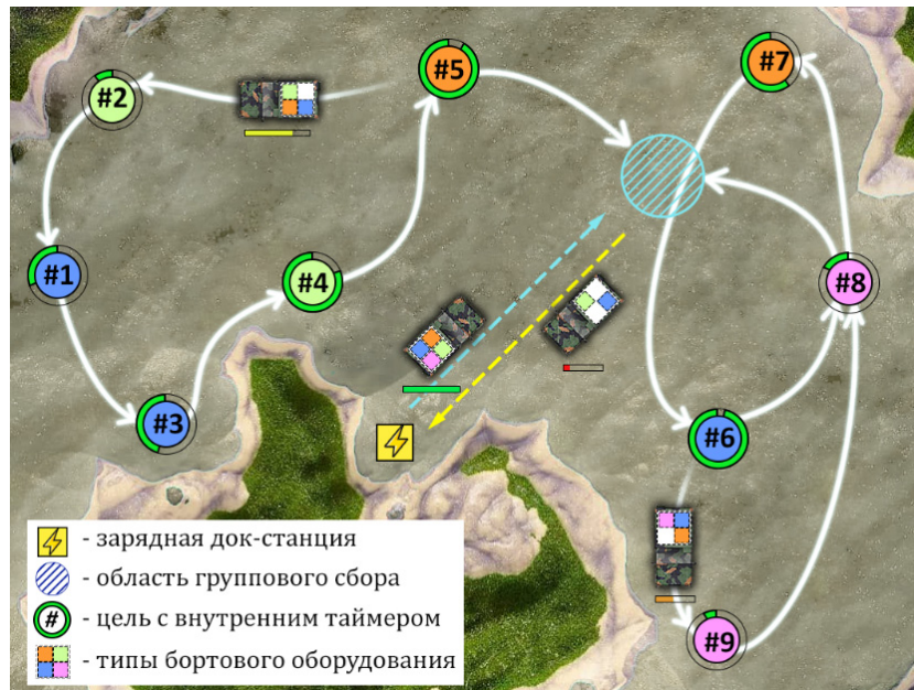
Рис. 1. Схематическое представление выполнения миссии по комплексному мониторингу области гетерогенной группой наземных АМР с непостоянным составом.

Описанная задача комплексного мониторинга содержит в себе особенности сразу нескольких известных NP-трудных транспортных задач: систематического наблюдения ( persistent surveillance problem ) [5], «зеленой» маршрутизации ( green vehicle routing problem ) [6], задачи мультикоммивояжера и ряда других вариаций классической задачи маршрутизации транспорта. Такие задачи маршрутизации, объединяющие в себе целый спектр различных ограничений и требований, в современной литературе принято относить к широкому классу комплексных или много-атрибутных задач маршрутизации ( rich/multi-attribute vehicle routing problem ,) [7]. В литературе представлено большое количество работ, посвященных перечисленным моделям транспортных задач, однако, подавляющее их большинство исследует достаточно узкие классы постановок.