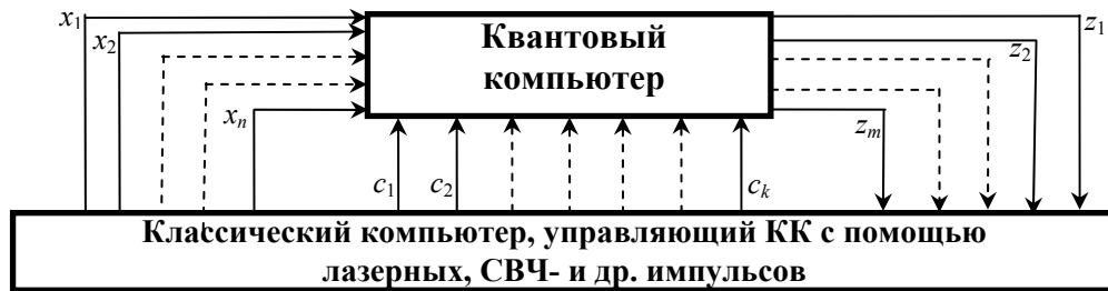
Рис. 1. Схема соединения КК и управляющего им классического компьютера.

Тогда \nu = \dim H_\ell – см. [1] и состояние квантовой системы описывается суперпозицией – см. выражения (2)-(5) в [1].